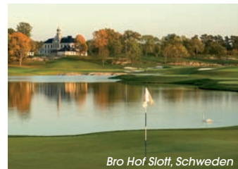
Bro Hof Slott, Schweden