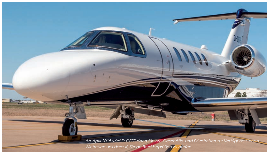
Ab April 2015 wird D-CEFE dann für Ihre Geschäfts- und Privatreisen zur Verfügung stehen. Wir freuen uns darauf, Sie an Bord begrüßen zu dürfen.