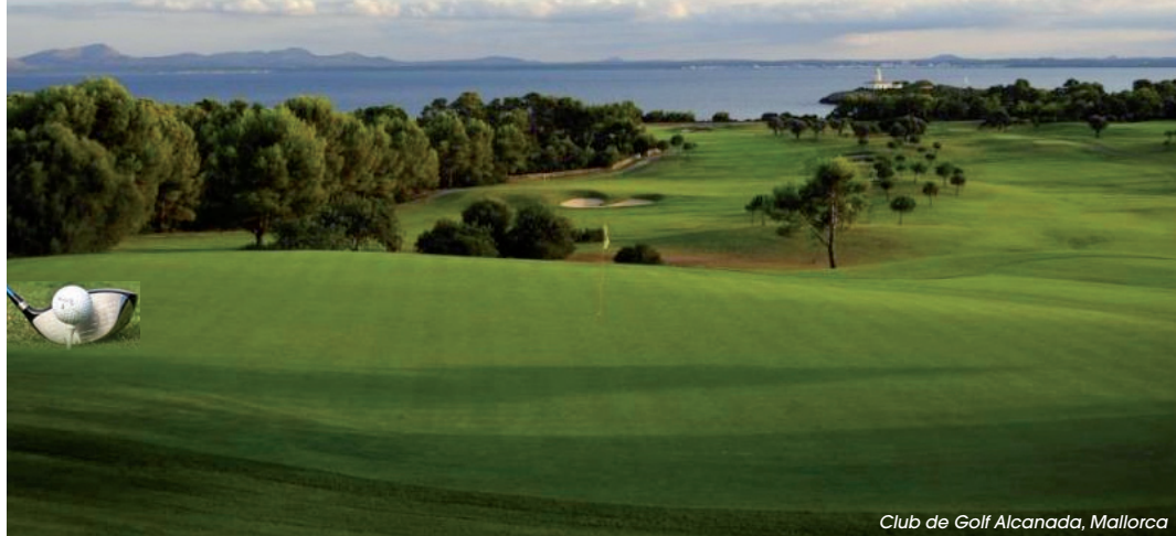
Club de Golf Alcandara, Mallorca

Viele können es kaum noch erwarten: am Tee stehen und der Leidenschaft freien Lauf lassen. In unseren Gefilden macht das Wetter noch nicht richtig mit und so liegt es nahe, in den Süden auszuweichen. Mallorca bietet mit 24 Golfplätzen und einer Durchschnittstemperatur von 20 bis 25° C ein ideales Anflugziel.