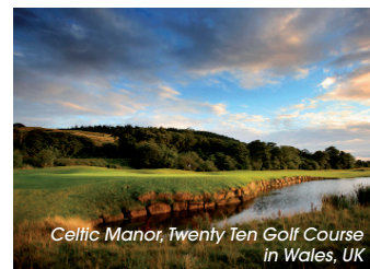
Celtic Manor, Twenty Ten Golf Course in Wales, UK